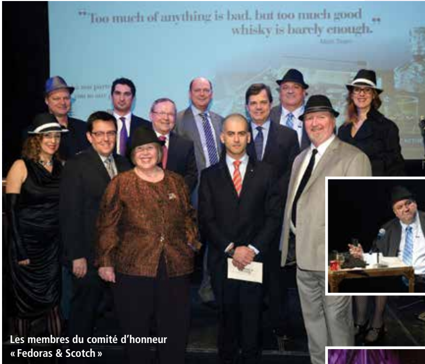
Les membres du comité d'honneur « Fedoras & Scotch »